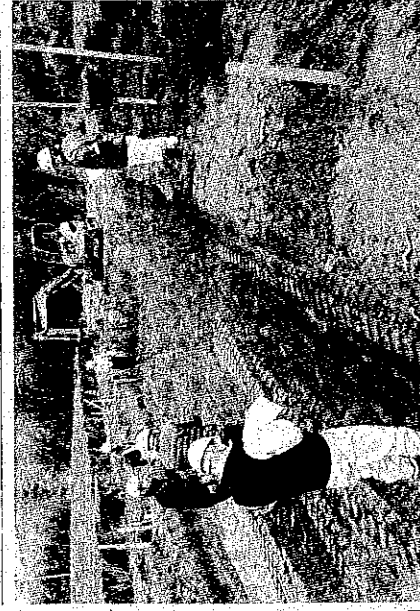
寒さなどへの対応を呼びかけたパト=さつま町内の現場

打ちによる安全管理・雇 用改善ハットールを実施 した。厳しい寒さに対す る安全管理の対応をほし め、危険箇所への注意喚 起看板設置の徹底などを 呼び掛けた。 パトは、役員と経営者、 現場代理人8人で構成。 2班に分かれて、道路改 築(泊野道路30の16工区) 国道504号久保農業、 農村地域防災減災事業 (土砂崩壊)浅井野地区 30の1橋本建設、県営 中山間地域総合整備事業 宮之城地区30の1(英開 発)の3現場を視察した。 現場では、現場代理人 に同日の作業内容や安全