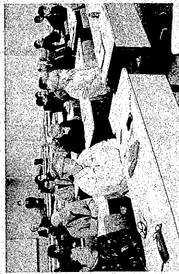
新規登録へ最新知識を学ぶ参加 者「鹿見島市のかごしま県民交 流センター

最新の住宅リフォームに 関する知識を学んだ。 研修会は、住宅新築ま たはリフォーム工事に関 する10年以上の実務経験 者が対象。相談員として 登録されれば、同センタ ーをはじめ、県・市町村 の関係窓口で随時閲覧さ れる名簿が置かれ、消費 者からの相談に応じるこ とができる。